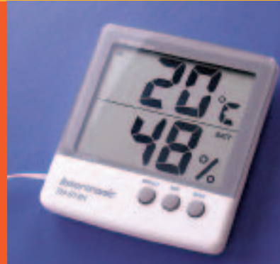
Ideale Raumtemperatur 20°C