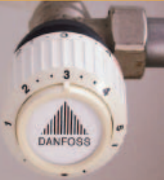
Thermostat richtig einstellen